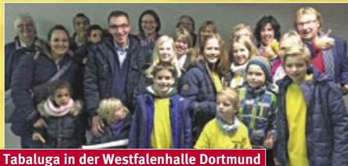
Tabaluga in der Westfalenhalle Dortmund

es Text lernen, Stimme warm-singen und sich mit den Mikrofonen und Kopfhörern vertraut machen. Das Ergebnis lässt sich hören und der „Familienchor“ des Kinderhospizdienst Ruhrgebiet ist definitiv nicht zum letzten Mal im Tonstudio gewesen.